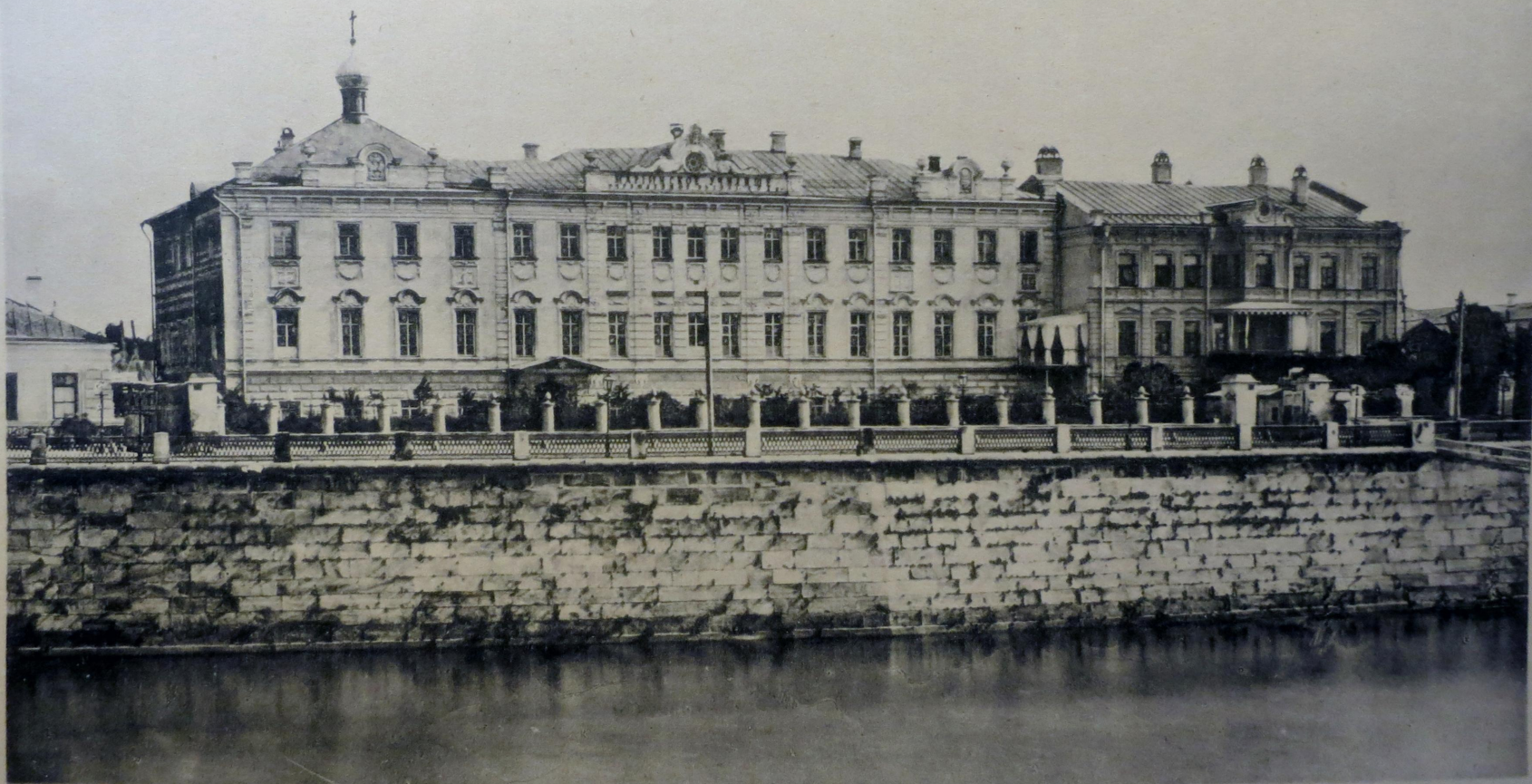
Маринское Училище съ 1875 г.