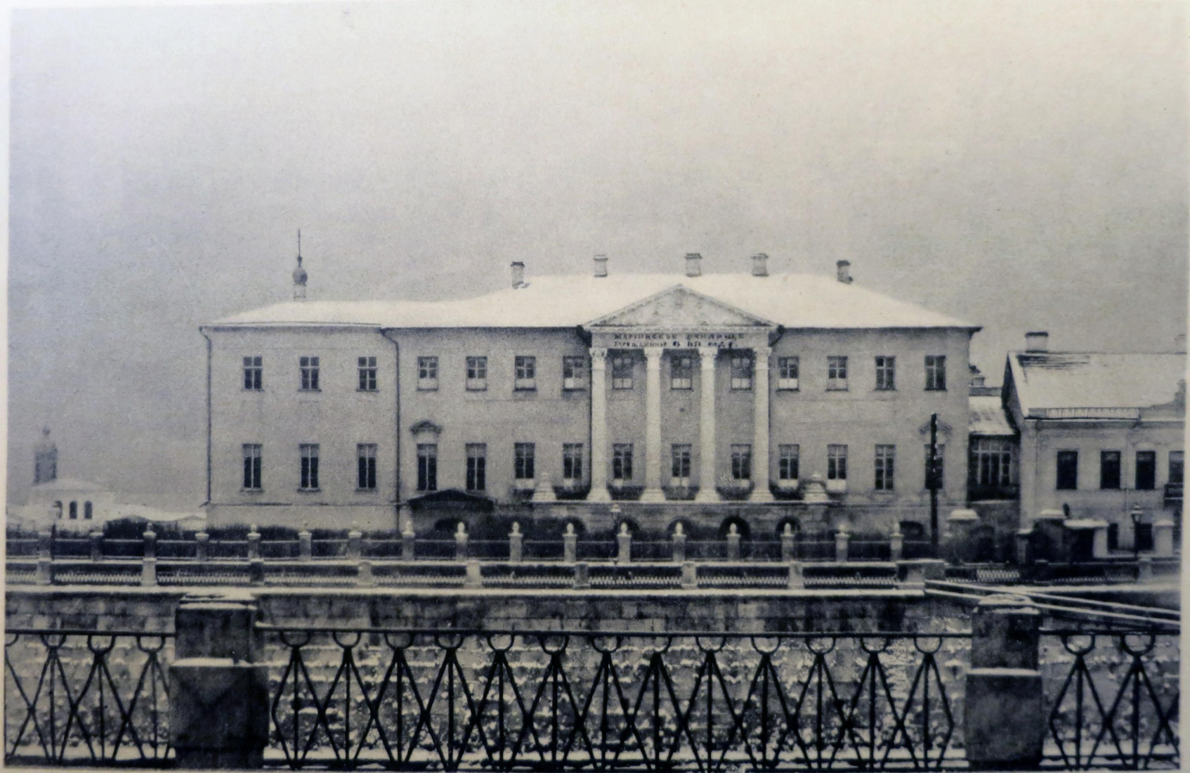
Мариинское Училище до 1875 г.